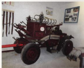
Historická ruční a motorová stříkačka z r. 1925