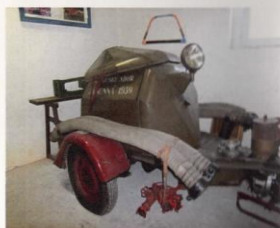
Historická motorová stříkačka z r. 1939